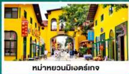
หมู่บ้านมื่อเออร์เกง