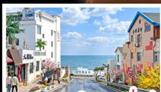
ถนนคอปเปลิ่งสาขาที่เปิด