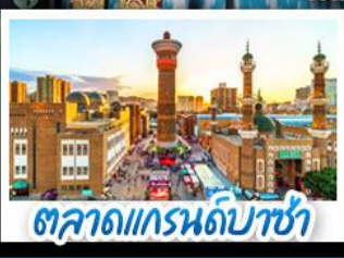
ตลาดแกรนด์บาซ่า