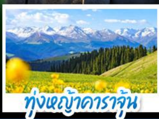
ทุ่งหญ้าคาราจัน