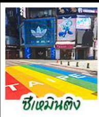
ซีเหมินตง

สัมผัสเสน่ห์แห่งเกาะฟอร์โมซา • ล่องเรือสุริยันแจนตรา ทะเลสาบที่สวยงามแห่งหนึ่งของไต้หวัน เกาะลาลู • วัดเหวินอู่ วัดศักดิ์สิทธิ์ริมทะเลสาบ • สักการะพระอัฐิพระถังซำจั๋ง • ชิมขนมพายฮับโปรด ของฝากยอดนิยม • อนุสรณ์สถานเจียงไคเช็ค แคมป์มาร์กทางประวัติศาสตร์ • ชีเหมินตง ย่านช้อปปิ้งสุดฮิต จิวเฟิ่น หมู่บ้านโบราณโคมแดง บรรยากาศสุดคลาสสิก • ลีอเฟิ่น ปล่องไคนลอย • ไทเป 101 ดึงดูด สัญลักษณ์แห่งความทันสมัย • จงซาน ย่านคาเฟ่และไลฟ์สไตล์สุดฮิต • วัดหลงซาน วัดเก่าแก่ เสริมสิริมงคล