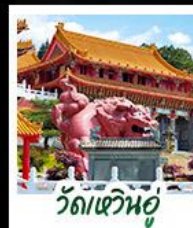
วัดเหวินอู่