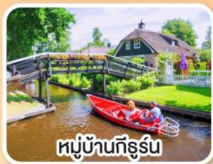
หมู่บ้านกิธูร์น