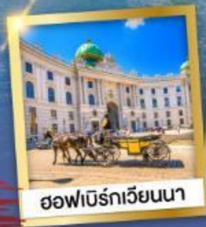
ฮอฟบิรท์เวียนนา