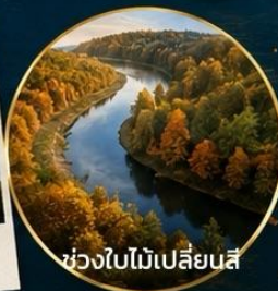
ช่วงใบไม้เปลี่ยนสี