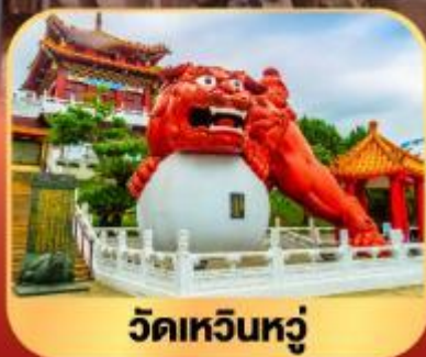
วัดเหวินหลู่