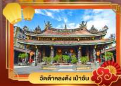
วัดต้าหลงตง เป่าอั้น